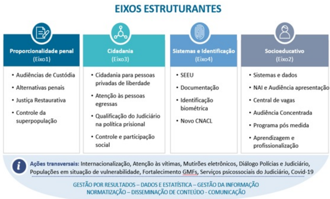
Eixos estruturantes do programa Fazendo Justiça e suas principais iniciativas

Para apoiar o processo de implementação e sustentabilidade das iniciativas do Fazendo Justiça em cada estado, o CNJ, em parceria com o PNUD, disponibiliza uma equipe de profissionais com expertise técnica, trajetória em políticas públicas e atuação nos sistemas de justiça e no socioeducativo.